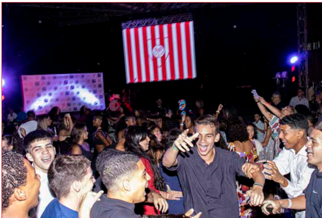
A manifestação da alegria da juventude tijuicana!