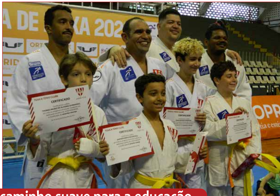
Um caminho suave para a educação...