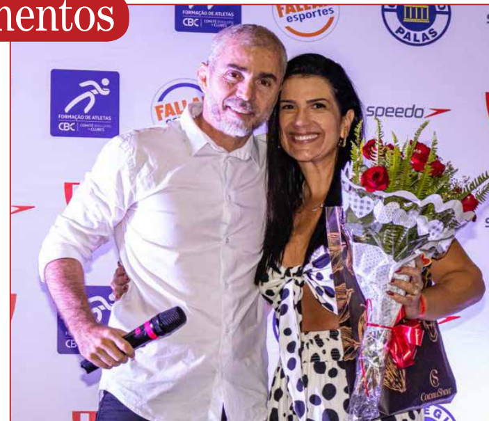
VP. Borel e sua esposa