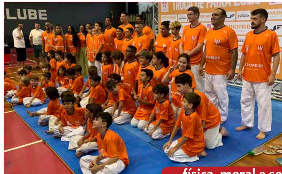
... física, moral e social!