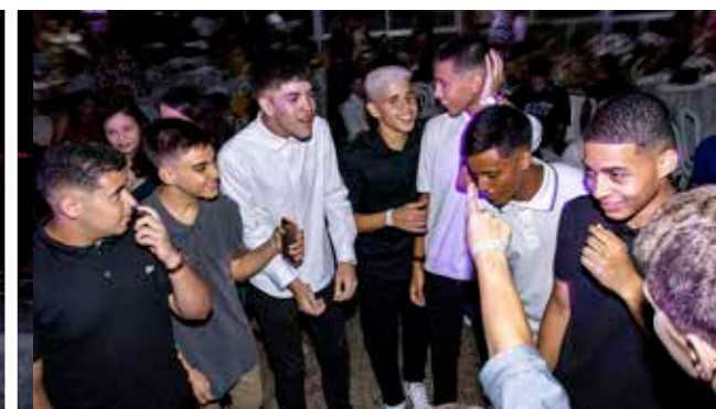
Força vibrante de um grupo heterogêneo!